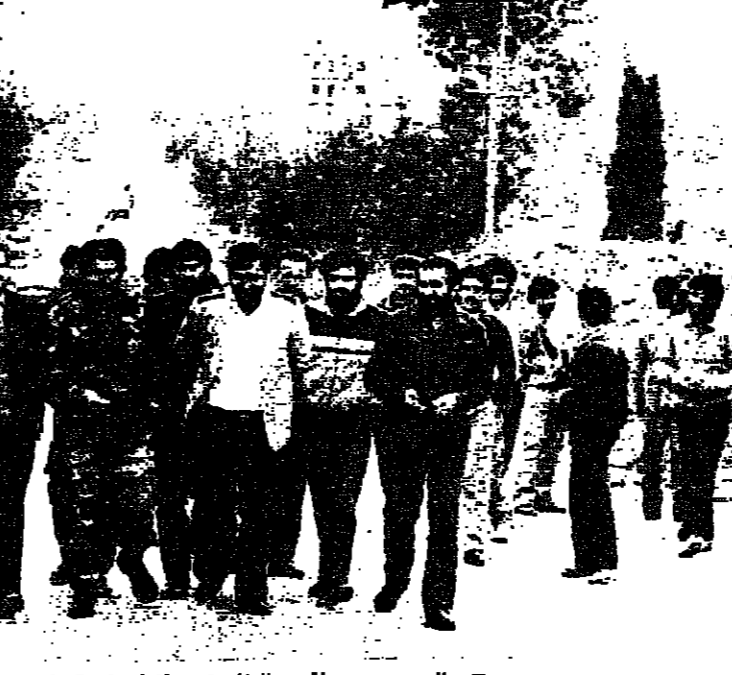
لقاء الامم والابناء